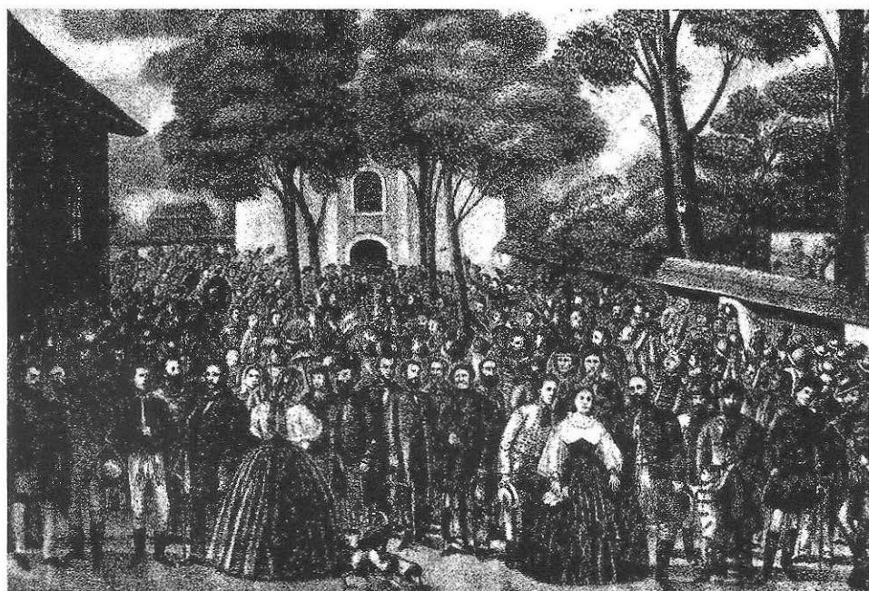
Obr. 1. Memorandové zhromaždenie v Turči. Sv. Martine dňa 6. a 7. júna 1861. Litografia W. F. Koutnika z roku 1864