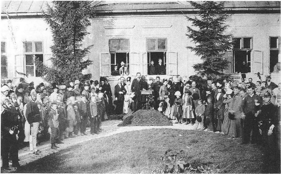
Obr. 2. Otvorenie Výstavy slovenských výšiviek v Turč. Sv. Martine v roku 1887. Fotoarchív SNM v Martine. Foto autor neznámy, č. neg. 43 055

už nemali vlečku. V radoch manželiek slovenských intelektuálov sa však turnýra (na rozdiel od krinolíny) neujala; ich šaty boli vkusné, často okolo hrdla a zápastia zdobené jemnými bielymi čipkami alebo výšivkami. Nešlo však o preberanie ornamentálnych prvkov zo sviatočného ženského ľudového odevu možno aj preto, lebo sa začala používať textilná galantéria, rozšírila sa konfekcia.