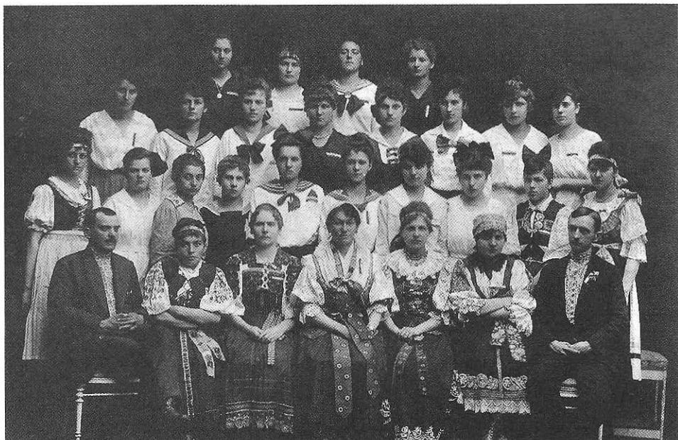
Obr. 3. Pedagogický zbor slovenských učiteľov, učiteľiek a študentky, zač. 20. rokov 20. storočia.