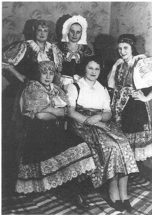
Obr. 6. Členky Slovenského spevokolu a Živeny na plese Živeny v 30. rokoch 20. storočia.