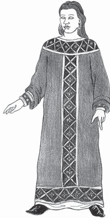
2. – Pokus o rekonštrukciu spôsobu nosenia gombíkov. Kresba Tereza Beranová.

Zaujímavé poznatky prinieslo i vyhodnotenie výskytu tohto artefaktu v hroboch podľa veku a pohlavia zomrelého. Gombíky sa vyskytujú predovšetkým v hroboch žien a dievčat. Na pohrebisku v Starom Městě „Na valách“ sa gombíky vyskytli